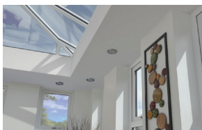
Lambrequin intérieur isolé